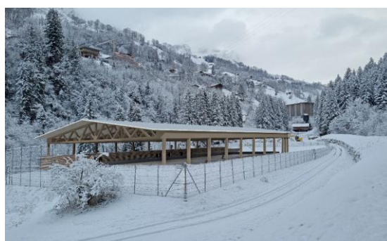
Abbildung 2: Visualisierung Kunsteisbahn mit Bedachung

Erste Investorengespräche mit dem Amt für Sport, Korporation Uri und anderen Interessenten haben den Wunsch nach einer bedachten Varianten konkretisiert. Mit einer bedachten Bericht Variante wird die Möglichkeit geschaffen, dass bereits ein Monat früher anfangs September mit dem Eishockeysport begonnen werden kann. Damit können auch Trainingslager für auswärtige Eishockeyvereine angeboten werden, was die Nachhaltigkeit der Anlage mit einer noch breiteren Abstützung von Einnahmequellen stärkt.