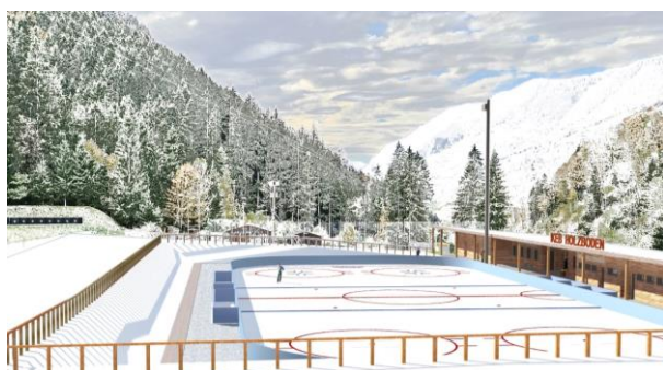
Abbildung 1: Erste Projektidee – offene Kunsteisbahn

Ursprünglich ist man beim Projekt von einer offenen Kunsteisbahn ausgegangen. Einerseits wollte man das Projekt etappiert entwickeln, und andererseits war auf Grund der Schiessanlage eine Bedachung nicht möglich.